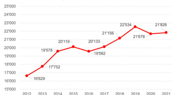
Anzahl Arbeitsvermittlungen der IV-Stellen 2012-2021

Quelle: IVSK-Datenerhebung bei allen IV-Stellen zu den Abschlussergebnissen Eingliederung