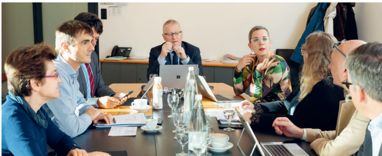
Das Ressort Interne Dienstleistungen an der Arbeit. Le ressort Prestations de services internes au travail.