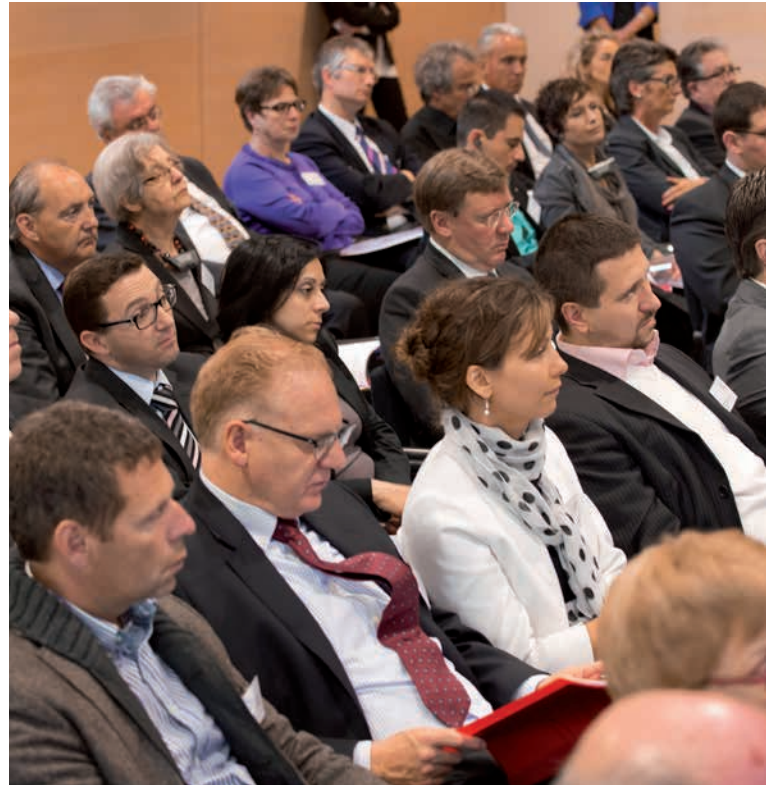
Bilder aus der Geschichte der IVSK Images historiques de la COAI