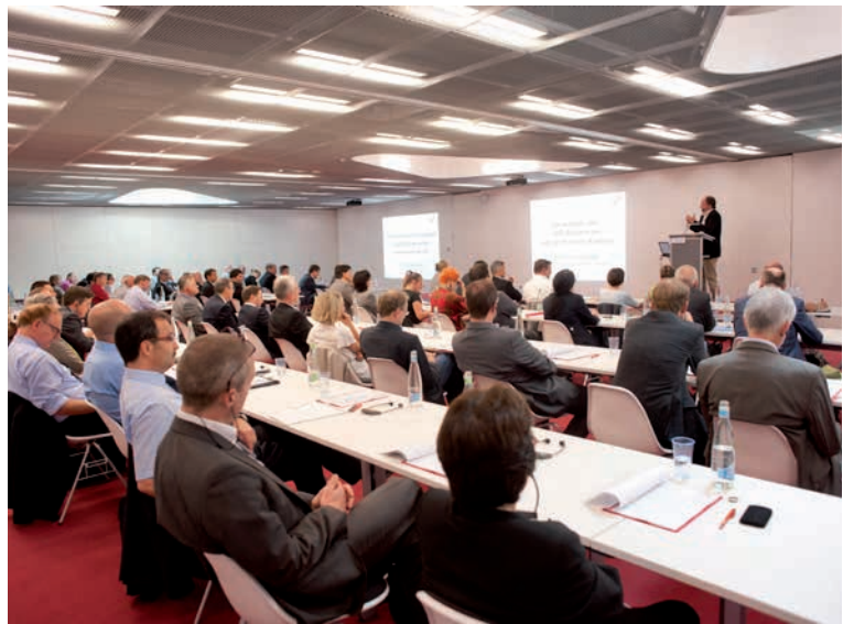
Bilder aus der Geschichte der IVSK Images historiques de la COAI

Es bot sich daher an, die 100. Mitgliederversammlung entsprechend zu feiern. Leider mussten die geplanten Feierlichkeiten aufgrund der pandemischen Lage kurzfristig abgesagt werden. Nichtsdestotrotz blicken wir gut gelaunt zurück auf bewegte Versammlungsjahre.