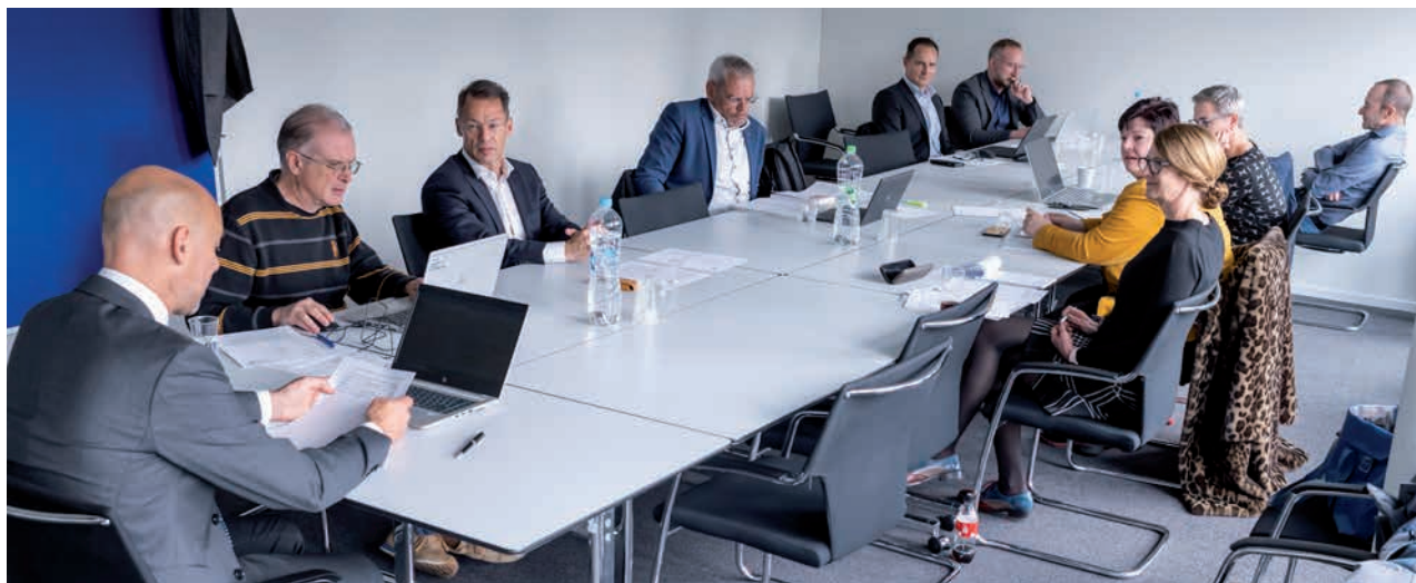
Das Ressort Leistungen für Versicherte an der Arbeit Le ressort Prestations pour assurés au travail