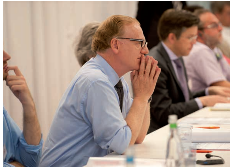
Bilder aus der Geschichte der IVSK Images historiques de la COAI

Die IVSK hat 2020 ihre Statuten überarbeitet und den aktuellen Entwicklungen angepasst. Das Ressortsystem wurde nochmals gestärkt, aber auch den Regionalkonferenzen wurde eine höhere Gewichtung zugeteilt. Die Mitgliederversammlungen werden gebraucht, um vermehrt über Themen zu diskutieren und Meinungsbildung zu betreiben. Aber auch die Geschäftsstelle hat sich entwickelt und spielt in ihrer Drehscheibenfunktion eine grössere Rolle im Verein. Hier laufen die Fäden zusammen und werden Informationen verteilt. Dabei hat sich die Geschäftsstelle personell stabil gehalten. Seit Gründung des Vereins waren auf der Geschäftsstelle drei Geschäftsführerinnen, drei Sekretärinnen und drei Kommunikationsverantwortliche tätig.