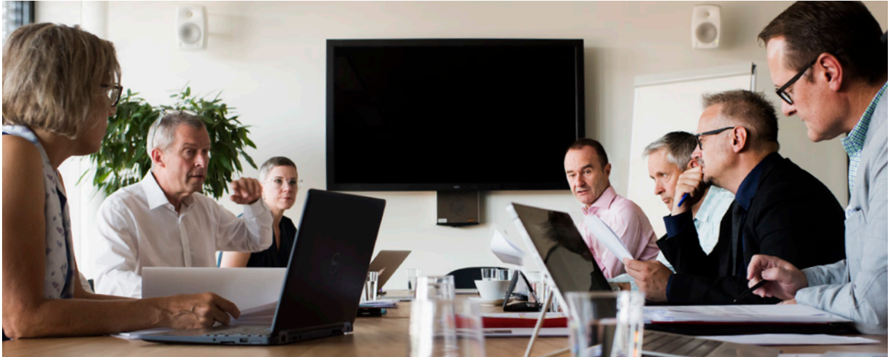
Das Ressort Integration an der Arbeit. Le ressort Intégration au travail.