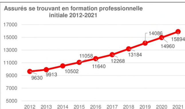
Source Data Warehouse du 1 er pilier (DWH1), Centrale de Compensation (CdC)